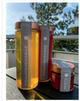
böckgemacht (#böckgemacht): Tomaten-Sauce, -Essenz und-Pesto.