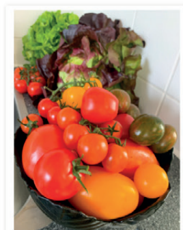
Auch Lust bekommen zu probieren?

Wie allgemein bei Nahrungsmitteln in meinem Haushalt, landete nicht ein Stück im Müll und ich teilte sogar mit ein paar lieben Menschen – ganz selten der Fall! 😊 Durch die Box genoss ich neben einer Burrata mit Tomaten und Basilikum, köstliche Pasta mit Gemüse und Pesto, einen herbstlichen Salat mit Gemüse und Ei und auch hier und da einfach nur zwischendurch einen rohen Gemüse-Snack. Richtig lecker!