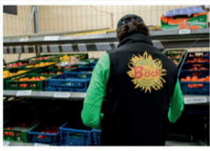
Hier werden die Boxen nach eurer Bestellung zusammengestellt.