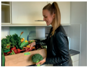
Ich freu' mich so über meine Gemüsebox.

📍 Anzeige 📅 9. November 2020 📄 Alle, bayerisch, Events/Kurse/Produkte & Co, Münchner Umland 📍 Gärtnerei Böck Neufarn, Gemüse, Online Lebensmittel, Online-Shop